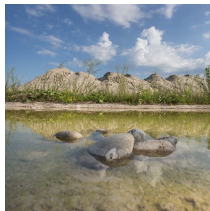
Biotop in Werkareal